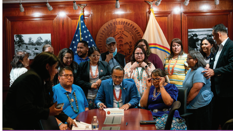
El presidente de la nación navajo, Buu Nygren, firmó la subvención para la expansión del Prekínder, reforzando el compromiso para lograr una educación de calidad para los pequeños estudiantes de la tribu.