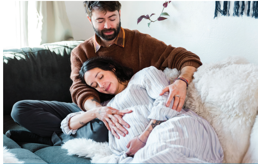
Moments Together del ECECD, familia.

Los resultados clave indican un conocimiento alto, ya que el 80 % de quienes respondieron la encuesta estaban familiarizados con los programas del ECECD, y un mayor uso del programa, en particular de los servicios de cuidado infantil, los cuales aumentaron 21 % desde el año 2022. Las familias informaron impactos positivos en el bienestar, donde el 89 % observó beneficios de participar en los servicios para la primera infancia. Los niveles de satisfacción también aumentaron, impulsados por los esfuerzos del ECECD por mejorar la calidad y la participación de la comunidad. Las barreras de acceso, como los costos, han disminuido ligeramente desde el año 2023. Para consultar el informe completo visiten el sitio web nmececd.org/2021/12/17/report-and-plans/ .