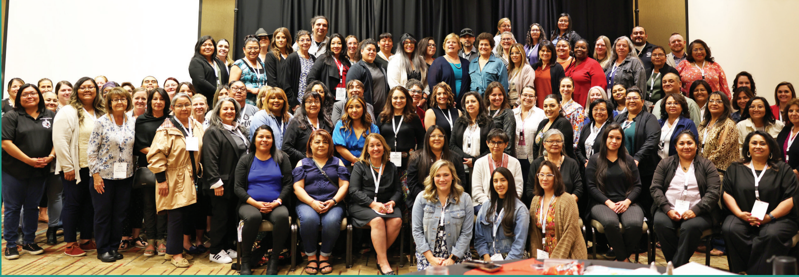
Reunión histórica de los directivos de Head Start y Early Head Start Leadership del ECECD: a nivel tribal y regional.