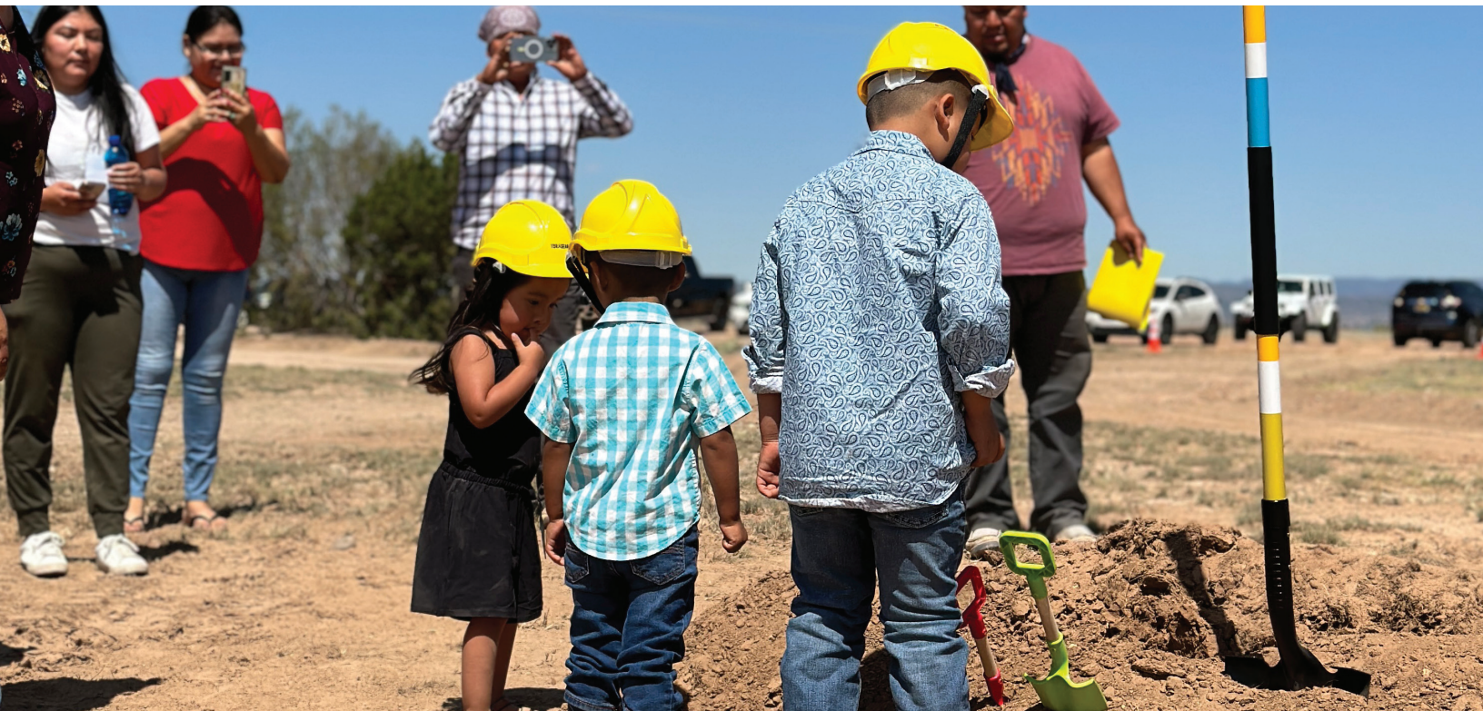
Niños kewa en la ceremonia de colocación de la primera piedra del Kewa Child Care and Family Engagement Center (Centro de Cuidado Infantil y Participación Familiar Kewa) en Santo Domingo Pueblo, Nuevo México, junio de 2023