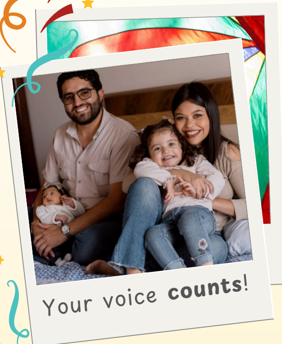
Your voice counts!